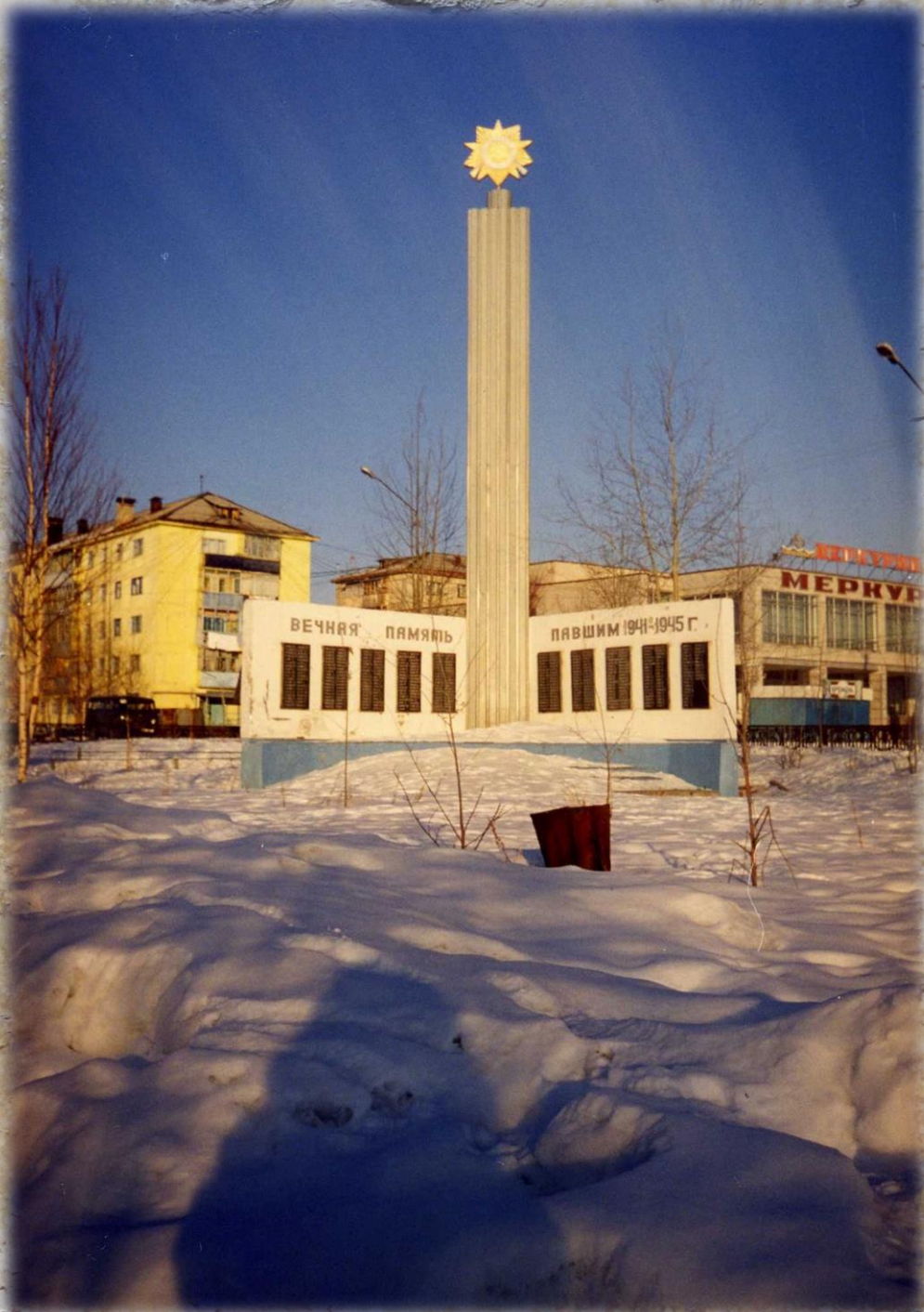
Общий вид обелиска в честь павших в годы Великой Отечественной войны 1941-1945 гг. Дата съемки: март 1998 года.

Архивный отдел администрации Белоярского района. Фотофонд. Опись 1. Дело 211. Лист 45.