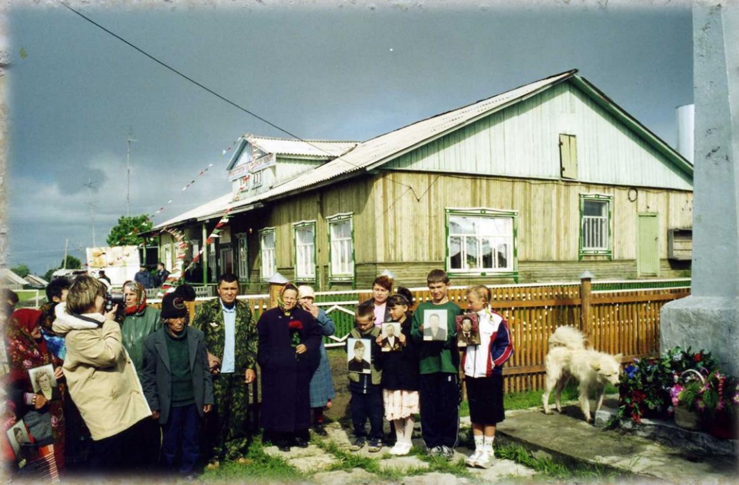
Жители села Ванзеват у здания Дома культуры и обелиска погибшим воинам в день празднования 220-летия села Ванзеват. Дата съемки: 14 июля 2002 года.