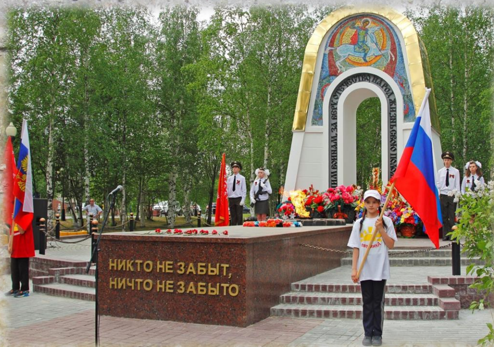
Общий вид обелиска «Память» с детьми, стоящими в почетном карауле в сквере Победы. Дата съемки: 4 июня 2015 года.

Архивный отдел администрации Белоярского района. Фотофонд. Опись 1. Дело 1502. Лист 1.