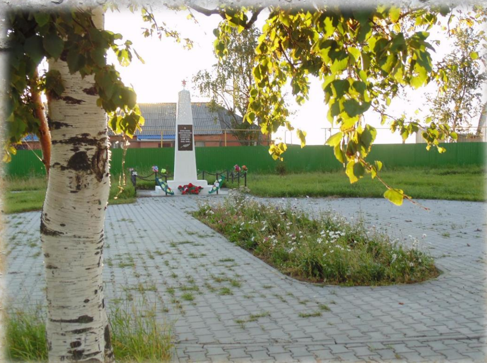
Обелиск в селе Полноват, установленный в память односельчанам, погибшим в годы Великой Отечественной войны 1941 - 1945 годов.

Архивный отдел администрации Белоярского района. Фотофонд. Опись 1. Дело 2365. Лист 1.