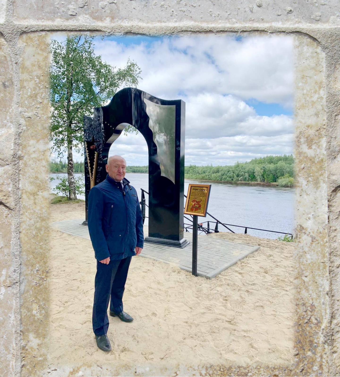
Глава Белоярского района Маненков Сергей Петрович во время открытия архитектурного ансамбля у обелиска воинской славы, установленного на месте ранее существовавшей деревни Кислор. Дата съемки: 19 июня 2020 года.