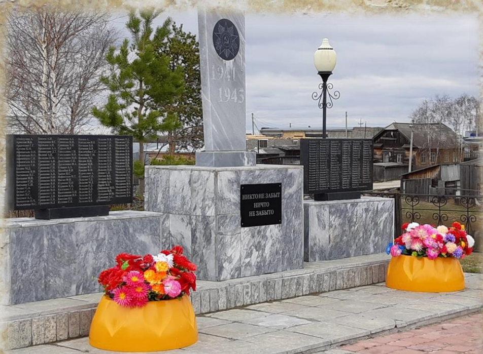
Мемориал погибшим воинам в годы Великой Отечественной войны 1941-1945 годов «Никто не забыт ничто не забыто» (до реконструкции) в селе Полноват, установленный в 2006 году перед зданием администрации. Дата съемки: 2020 год.

Архивный отдел администрации Белоярского района. Фотофонд. Опись 1. Дело 2365. Лист 1.