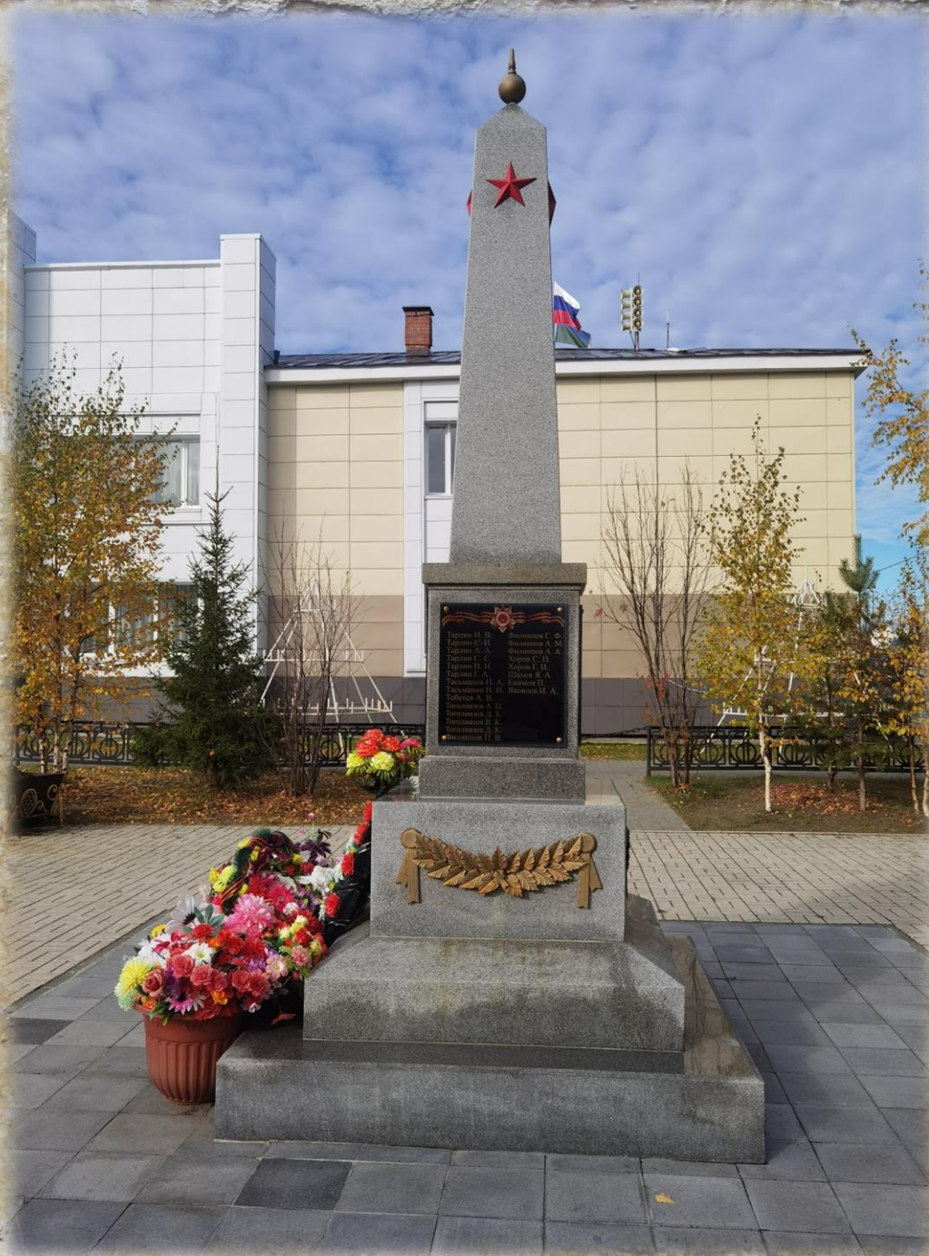
Монумент Славы, посвященный Победе в Великой Отечественной войне 1941-1945 годов, в селе Казым, открытие которого состоялось в 2017 году. Дата съемки: 26 сентября 2024 года.

Архивный отдел администрации Белоярского района. Фотофонд. Описание 1. Дело 2372. Лист 1.