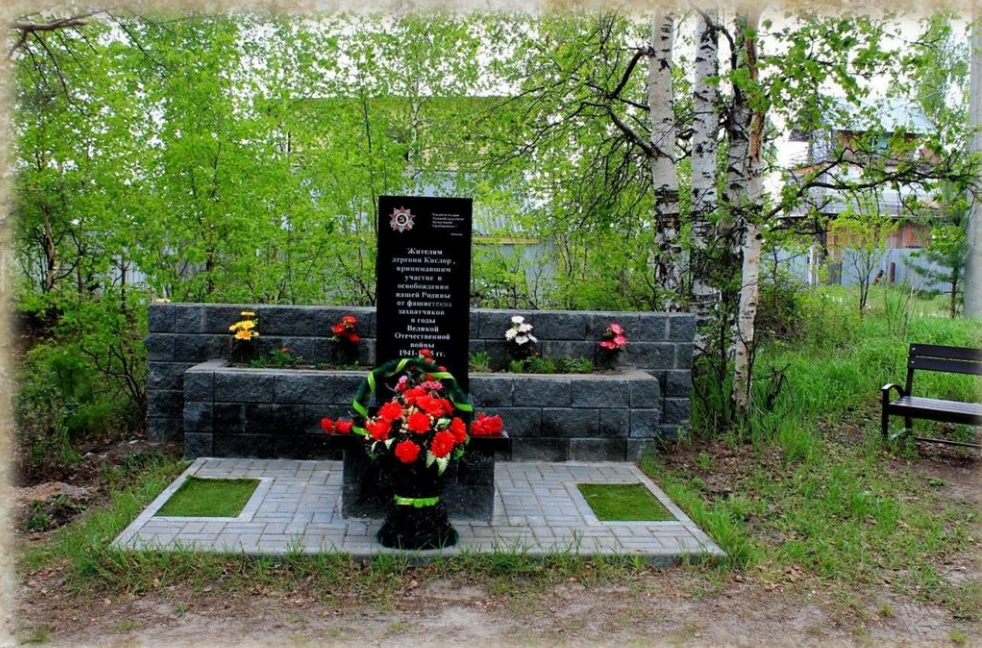
Памятник на месте ранее существовавшей деревни Кислор «Жителям деревни Кислор, принимавшим участие в освобождении нашей Родины от фашистских захватчиков в годы Великой Отечественной войны 1941-1945гг.», установленный к 70-летию Победы в Великой Отечественной войне 2 сентября 2015 года. Дата съемки: 2017 год.

Архивный отдел администрации Белоярского района. Фотофонд. Опись 1. Дело 1502. Лист 1.