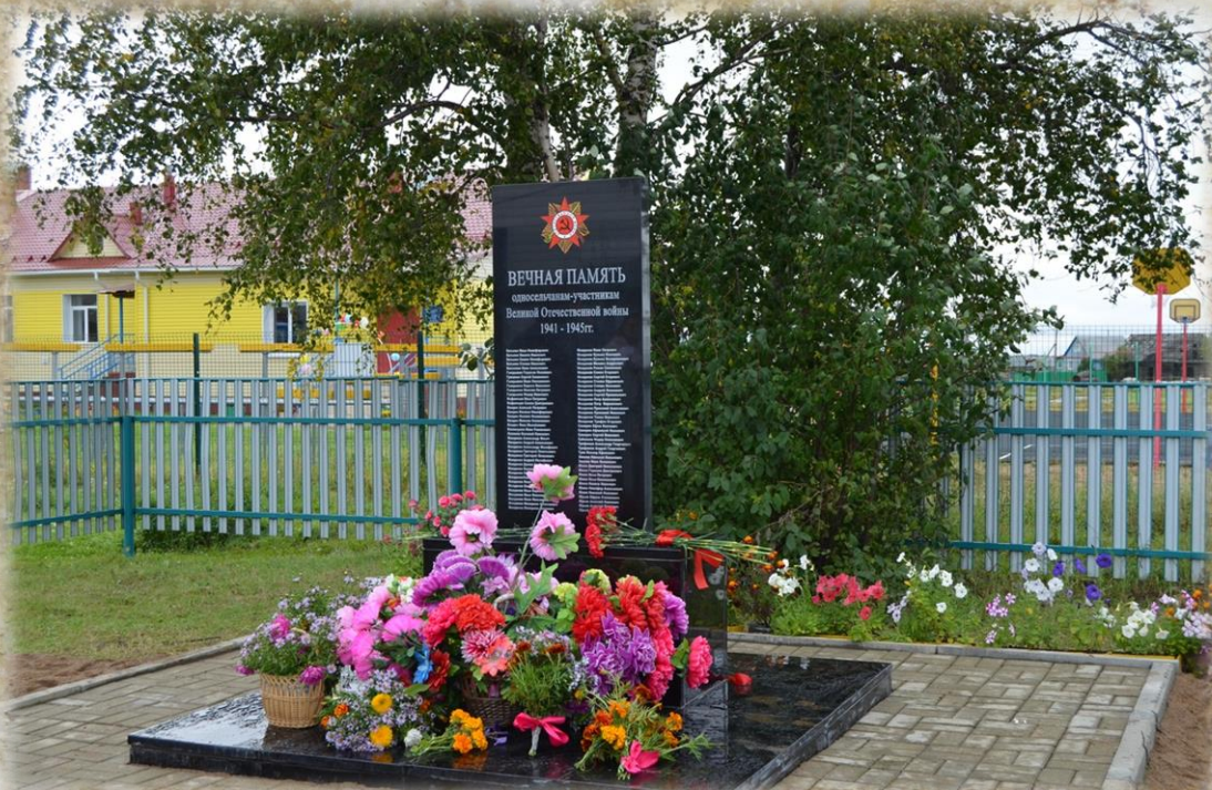
Мемориал памяти жителям села Ванзеват – участникам Великой Отечественной войны 1941-1945 годов, установленный на территории Дома культуры села Ванзеват. Дата съемки: 2 сентября 2019 года.

Архивный отдел администрации Белоярского района. Фотофонд. Опись 1. Дело 171. Лист 38.