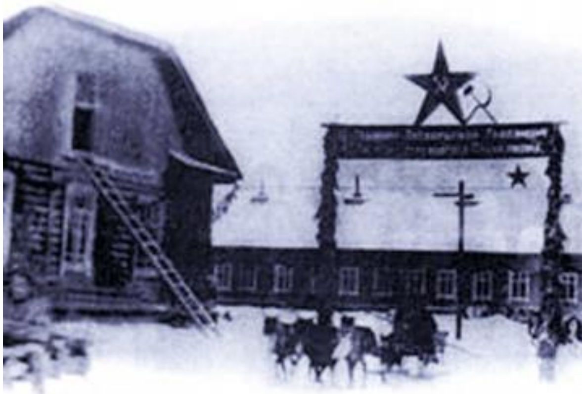
Общий вид Казымской культбазы в день оленевода (фотокопия) 1936 г.

КУ «Государственный архив Югры». Фонд 354. Опись 1. Дело 3. Лист 1.