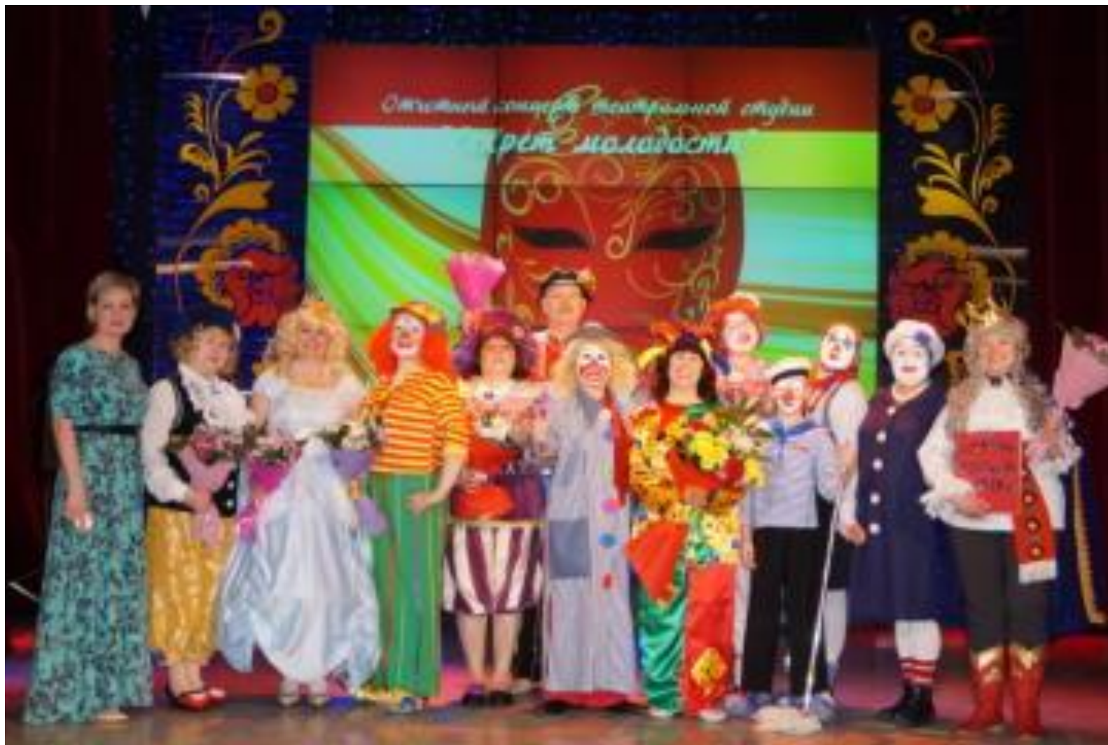
Участники театральной студии «Секрет молодости» дома культуры «Газовик». 2018 год

Уже 10 лет в городе работает театральная студия «Секрет молодости», объединившая людей преклонного возраста. В репертуаре около 30 инсценировок. В основном, это сказки на новый лад, на злобу дня.