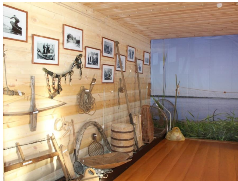
Экспонаты в музее с.Полноват