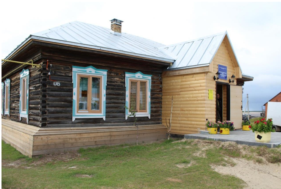
Здание музея в с.Полноват. 2019 год