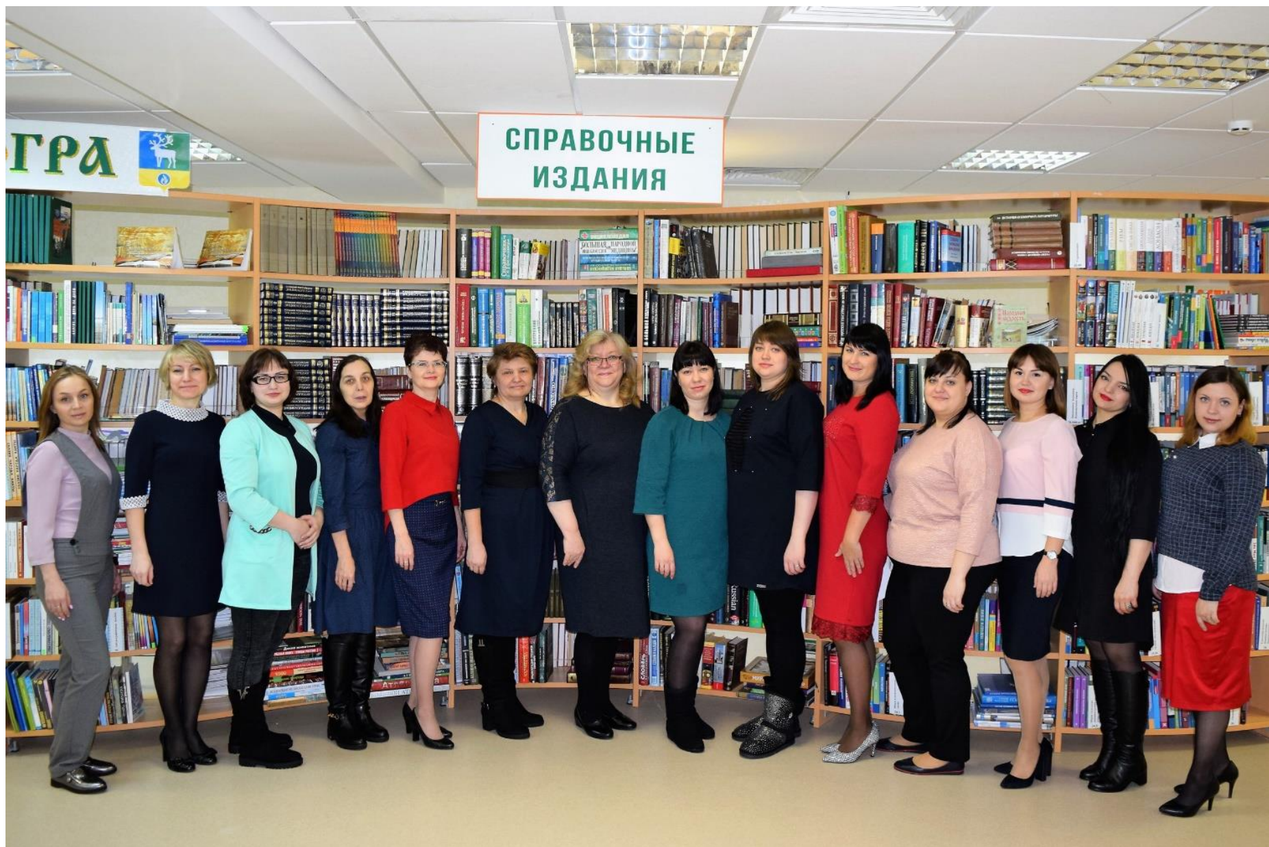
Общий снимок сотрудников библиотек Белоярского района во время семинара «Библиотека в контакте». 2018 г.