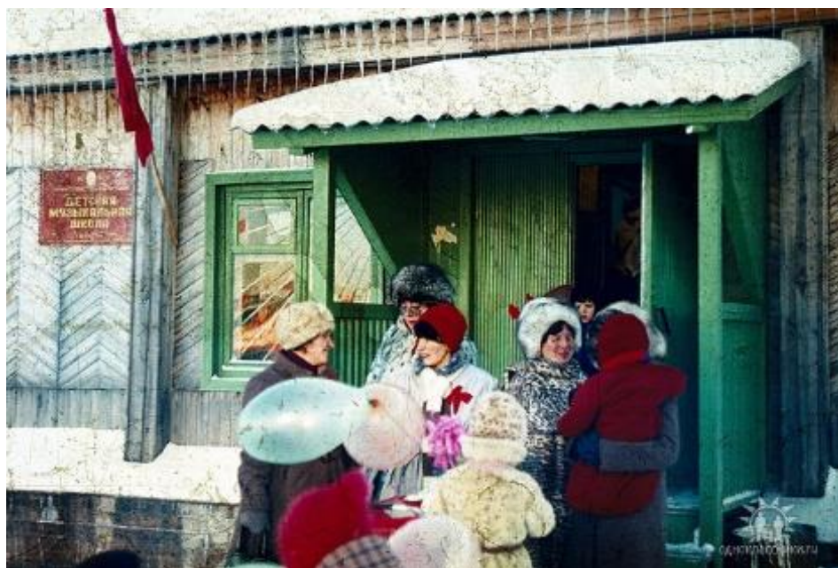
Первое здание музыкальной школы. 70-е годы 20-го столетия

В настоящее время школа имеет 6 филиалов в национальных и трассовых поселках. Дети обучаются на двух отделениях школы музыкальном и художественным. Гордостью школы являются ее коллективы: эстрадно-духовой оркестр под управлением Г.Гонтаренко, хоровой коллектив К.Аветисян, оркестр народных инструментов руководителя П.Макарова.