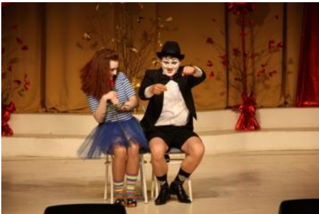
Члены творческого объединения «Конфетти» Белоярского политехнического колледжа, победители районного фестиваля-конкурса «Молодежная весна» в номинации «Театр эстрадных миниатюр». 2016 год

Для развития самодеятельных коллективов на территории Белоярского района проводится много конкурсов и фестивалей.