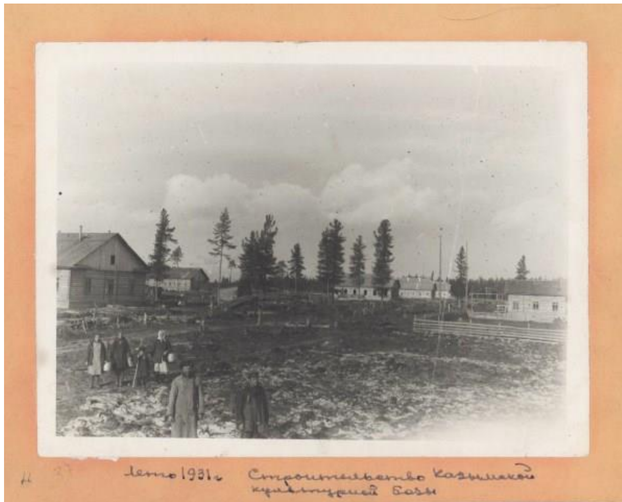
Здания – новостройки Казымской культурной базы. с. Казым Березовского района. 1931 год. КУ «Государственный архив Югры». Фонд Фотодокументов. Опись 1. Дело 1843.

В 1930 году началось строительство Казымской культбазы, одной из целей которой было поднятие культурно-политического уровня коренных народов Севера. К концу 1931 года культбаза включала в себя 14 построек: больницу, школу, интернат, Дом туземца, ветеринарный пункт, показательную юрту, банно-прачечную, склады, овощехранилище, ледник и кухню, три жилых дома.