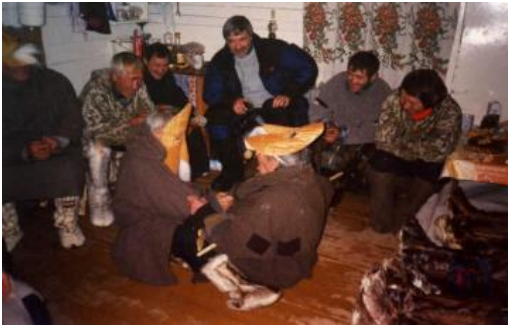
Исполнение шуточной сценки мужчинами в масках а во время проведения медвежьих игрищ. 2004 год

На территории музея проводятся национальные праздники: «Вороний день», «Медвежьи игрища», мастер-классы по декоративно-прикладному искусству.