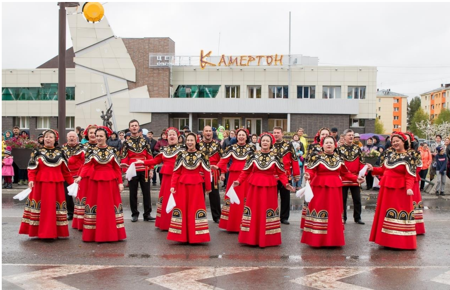
Хор русской народной песни города Белоярский. 2005 год

Городской дом культуры первоначально находился в переоборудованном помещении спортивного зала финского комплекса. 18 сентября 1998 года открылось здание Центра культуры и досуга «Камертон».