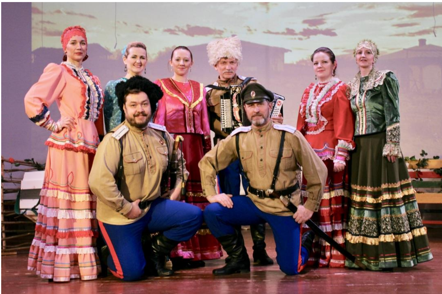
Коллектив ансамбля казачьей песни «Вольница» из поселка Сорум. 2018 год

В каждом поселении Белоярского района работают свои клубы и Дома культуры, которые развивают самодеятельное творчество, организуют досуг населения.