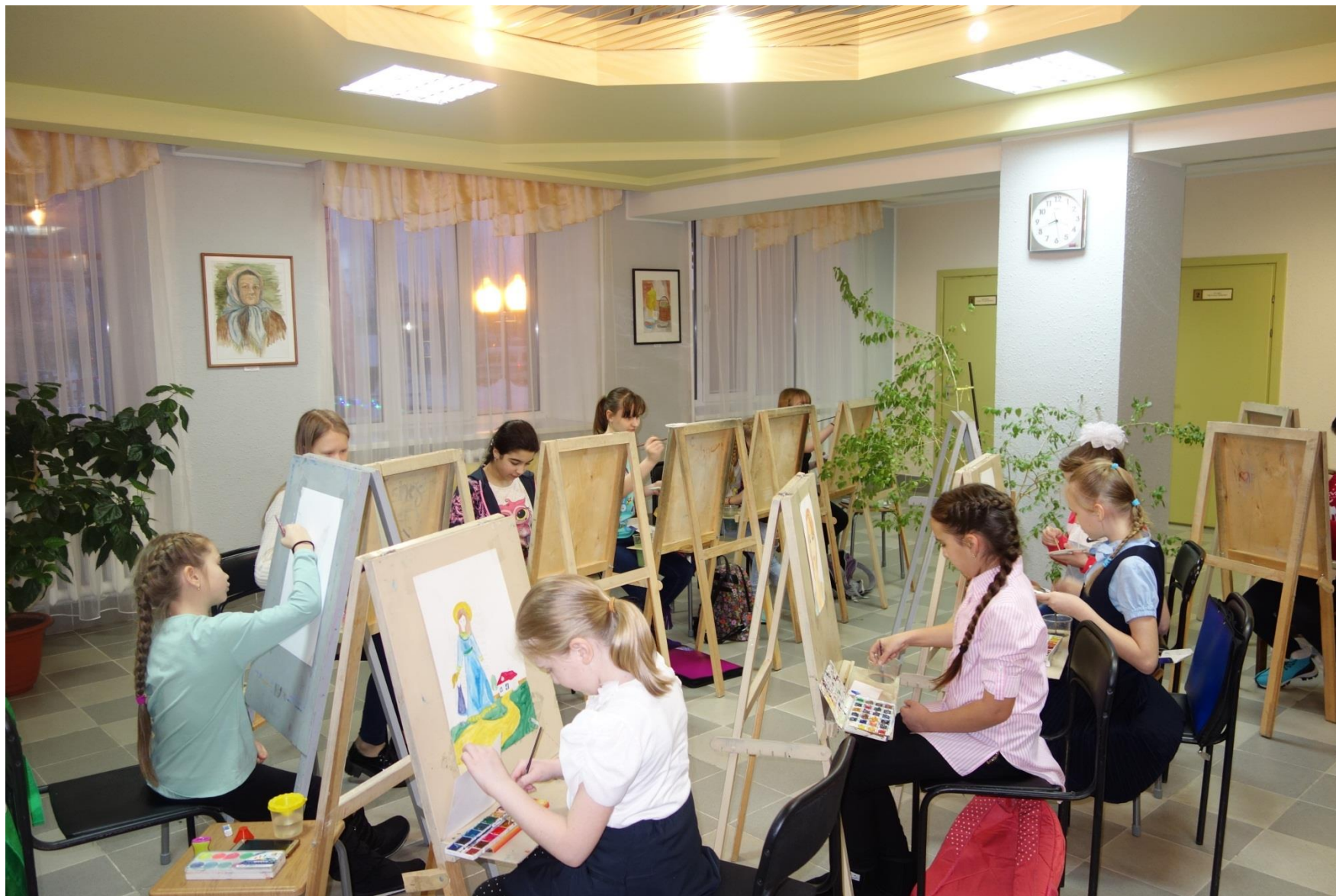
Учащиеся художественного отделения МАУДО Белоярского района «Детская школа искусств г.Белоярский». 2016 год

Архивный отдел администрации Белоярского района.