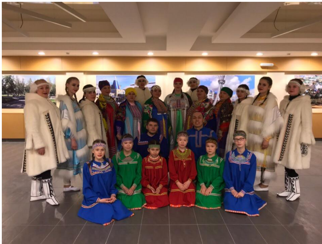
Участники народного самодеятельного коллектива «Увас Хурамат»

В мае 2005 года Департаментом культуры и искусства Ханты – Мансийского автономного округа – Югры за активную работу и пропаганду самодеятельного творчества, а также за высокое исполнительское мастерство коллективу «Увас Хурамат» было присвоено звание «Народный самодеятельный коллектив»,.