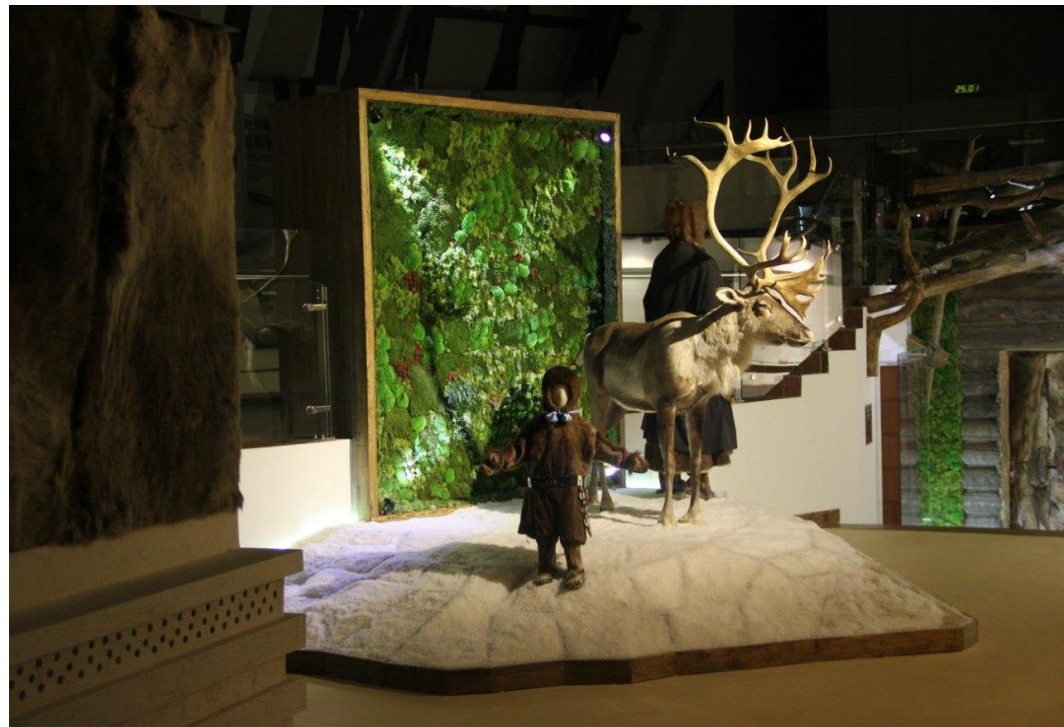
Выставочная композиция в зале «среднего мира» в музее. 2016 год

Архивный отдел администрации Белоярского района. Фонд Фотодокументов. Описание 1. Дело 1417