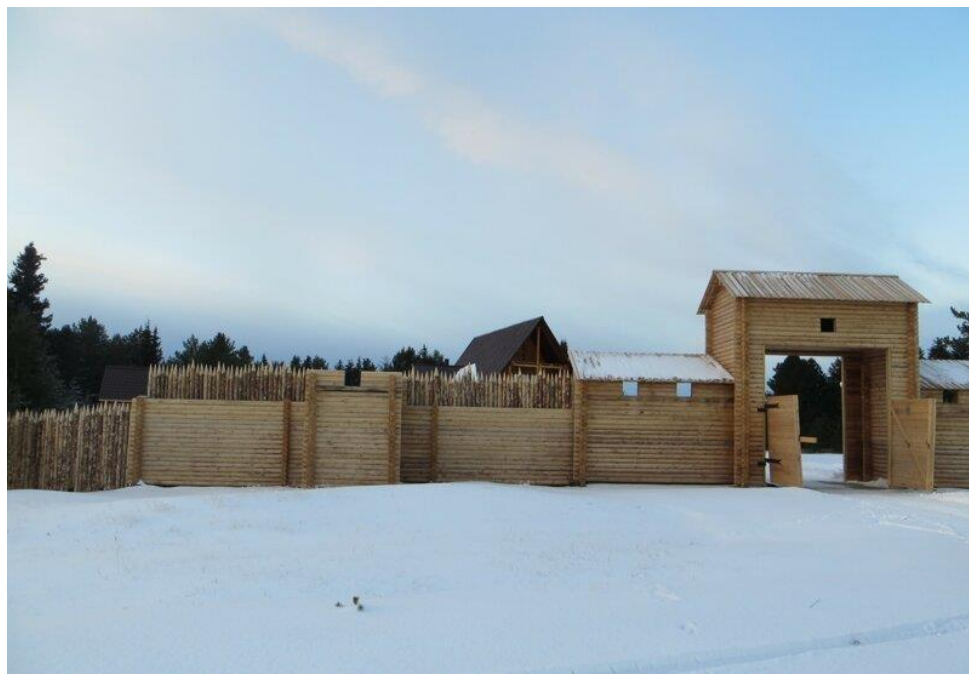
Входная зона музея под открытым небом в с.Казым. 2014 год

Архивный отдел администрации Белоярского района. Фонд Фотодокументов. Описание 1. Дело 1102