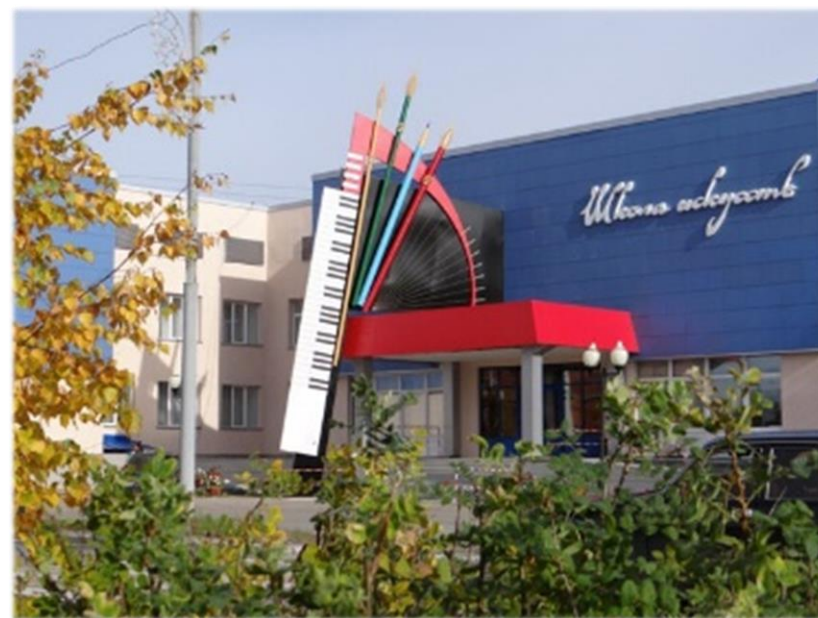
Здание школы искусств после реконструкции. 2016 год