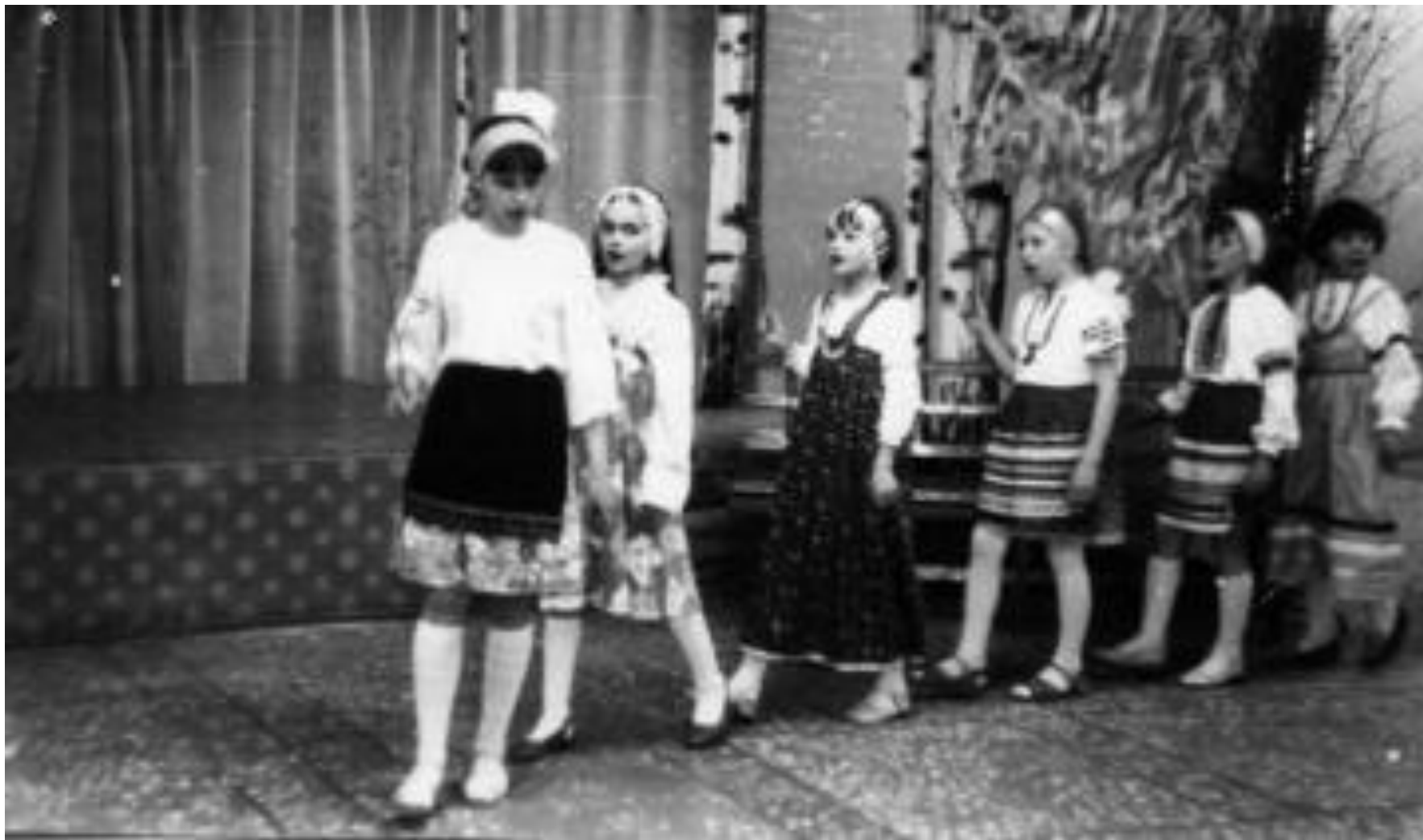
Первый отчетный концерт ансамбля "Родничок».