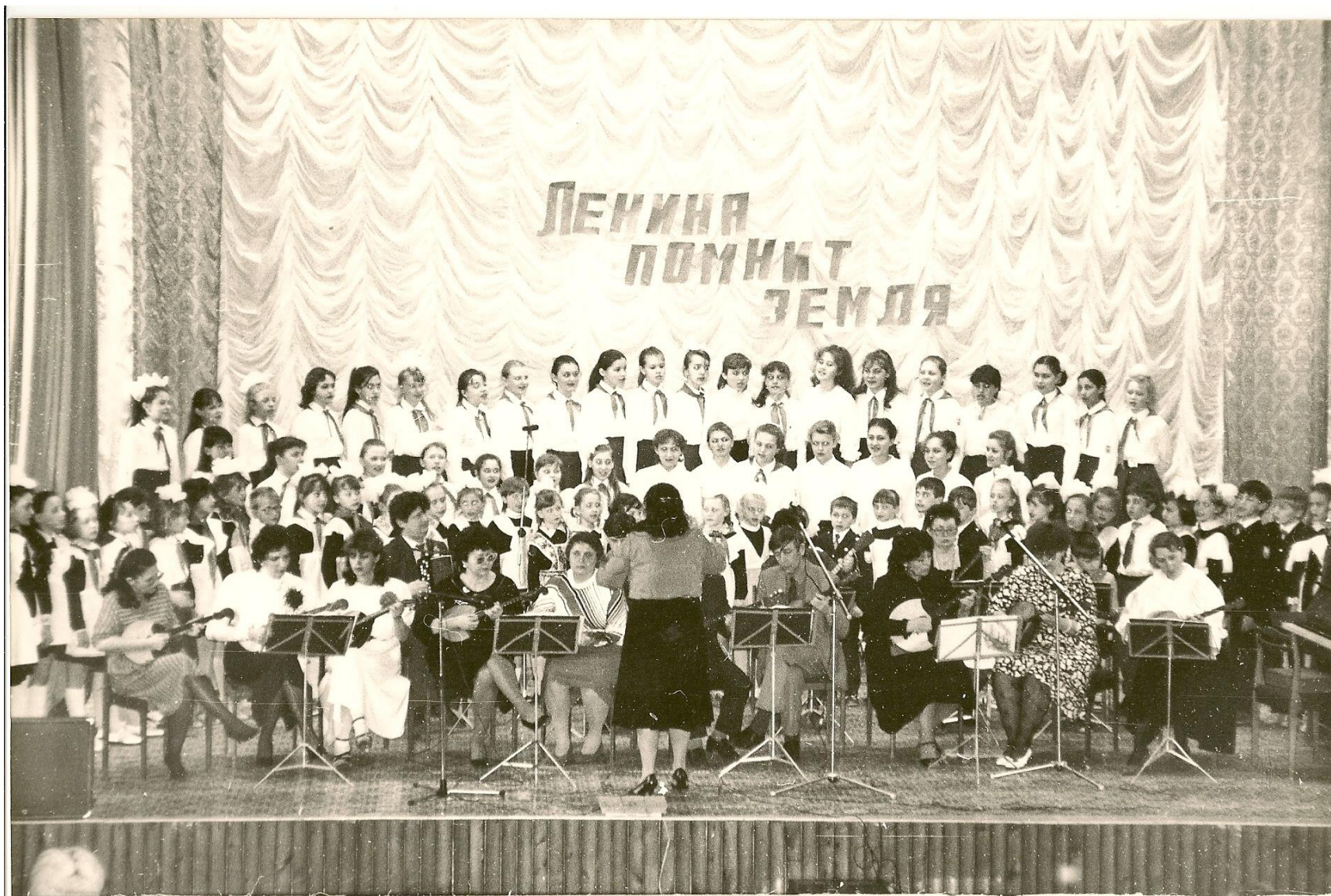
Выступление учеников и преподавателей детской музыкальной школы. 80-е годы

Архивный отдел администрации Белоярского района.