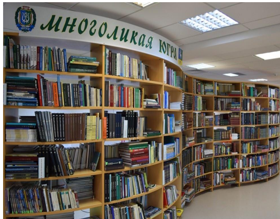
Стеллажи с книгами в помещении центральной библиотеке Белоярского